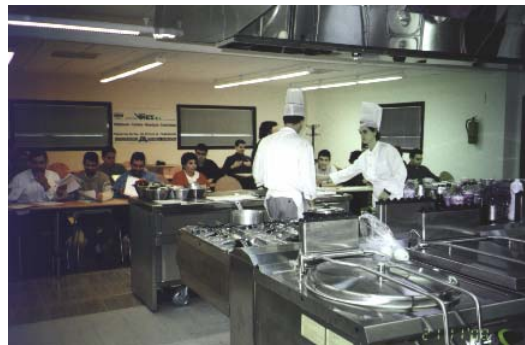
CENTRE COL.LABORADOR FORMACIÓ