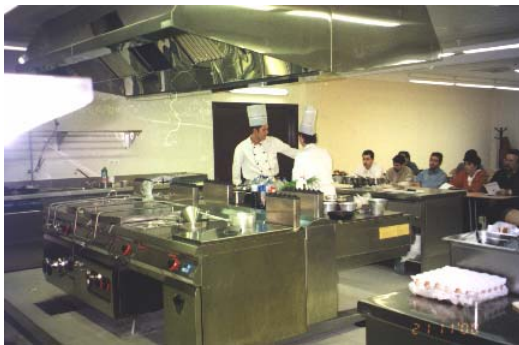
PATROCINADOR OFICIAL AULA

Polígon Ind. Riu-Clar, CL del Ferro cantonada CL Granit – 43006 Tarragona